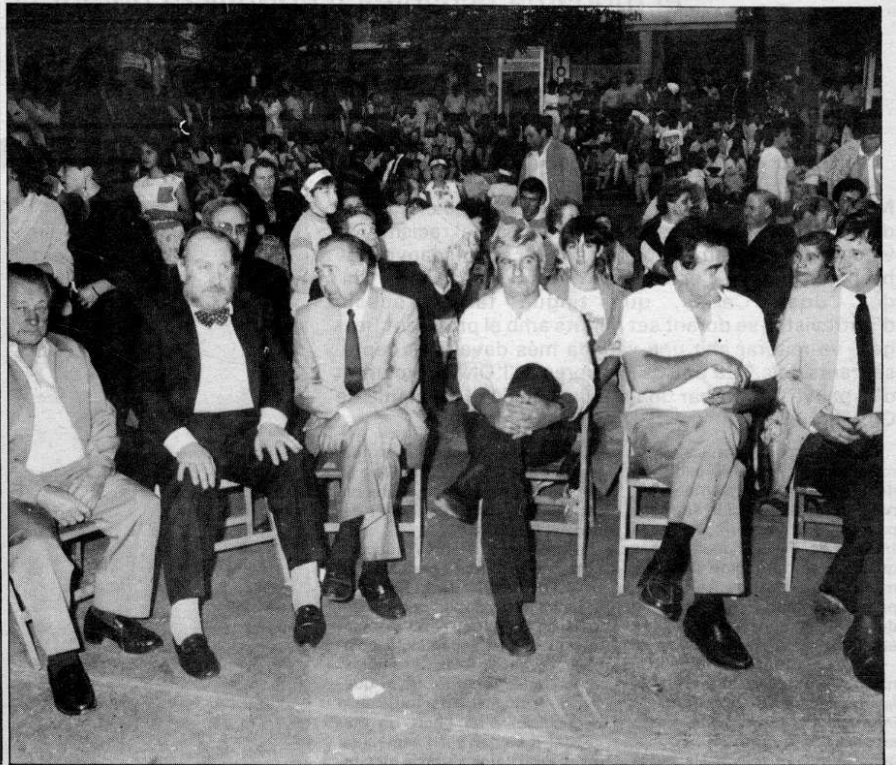
La campana «Cerdanya» anuncia l'agermanament dels dos costats de la comarca. A la foto de la dreta es veuen alguns alcaldes de la Cerdanya assistents als actes.

Diumenge es va celebrar la diada d'agermanament a Puigcerdà