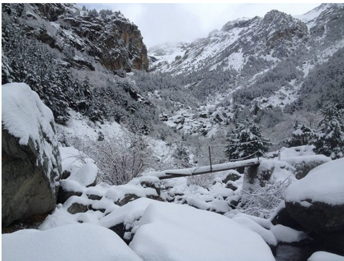
Paisatge ben nevad a les gorges del Freser.

Galeria de fotos de la nevada del cap de setmana