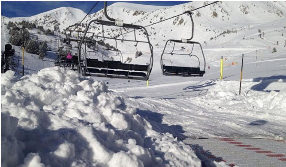
A Vallter es van acumular uns 30 cm de neu nova.