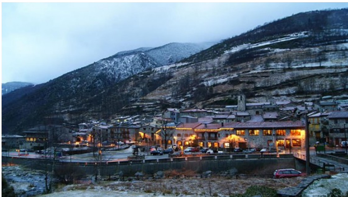
A Setcases ha nevat i plogut de manera intermitent.