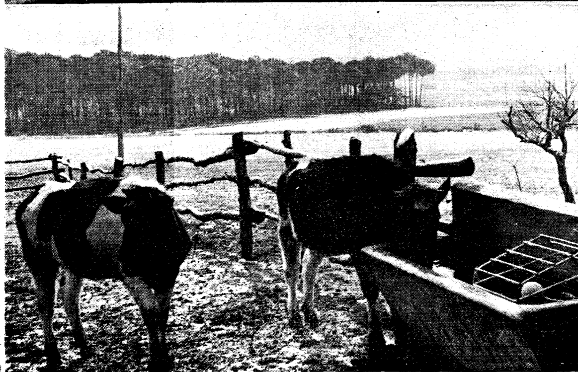
Comedero en una estabulación al aire libre en Cassá de la Selva, y bebedero en una estabulación al aire libre en Caldas de Malavella.