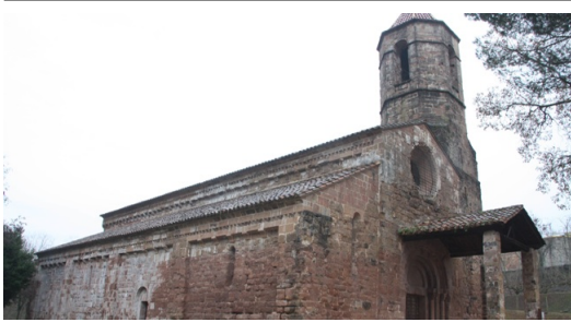
Prospeccions al monestir

L'augment de visites els darrers anys ha obligat a fer-hi millores, sobre tot en els accessos i conducció d'aigua