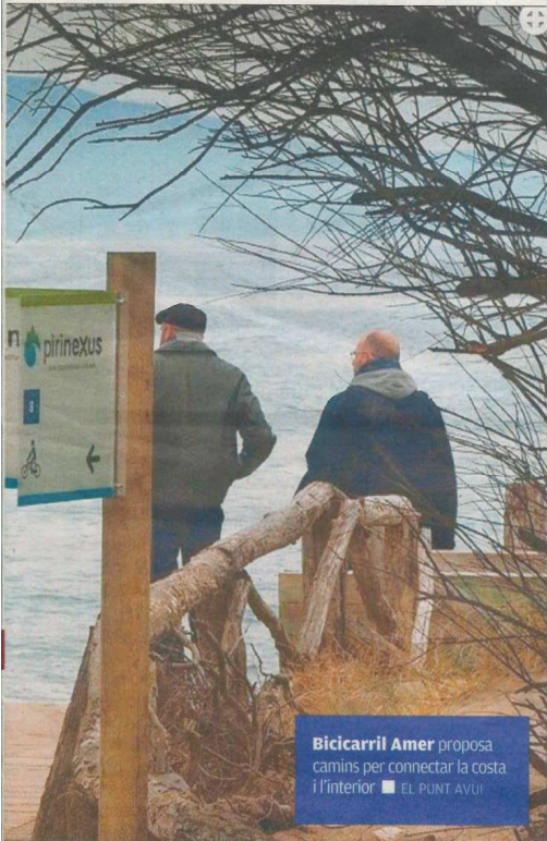
Bicicarril Amer proposa camins per connectar la costa i l'interior ■ EL PUNT AVUI

afavoreixi el llançament del producte resultant". Mentre que en la primera fase el pes ha recaigut en la construcció d'un ecosistema i el desenvolupament de la metodologia, en la segona es prioritzarà la consolidació d'un sistema regular, sostenible en el temps, i l'orientació a asso-