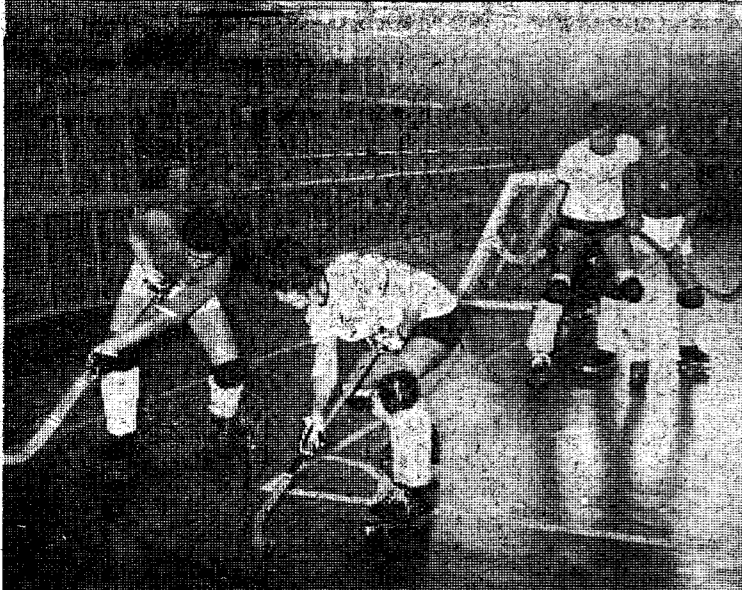
Se han reanudado tras el paréntesis motivado por las fiestas navideñas y de año nuevo. Precisamente, hoy domingo volverán a la competición los militantes en II División y en los diferentes campeonatos regionales.