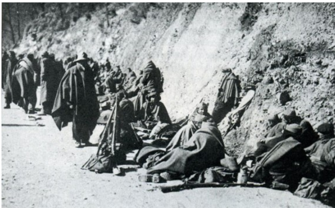
Soldats republicans descansant a la carretera de la Presta.

La segona foto de Prats de Molló publicada a l' Illustration és del camp de presoners. En aquest cas està situada correctament: « Un camp de miliciens gouvernementaux désarmés à Prats-de-Mollo (Un camp de milicians governamentals desarmats a Prats de Mollo)».