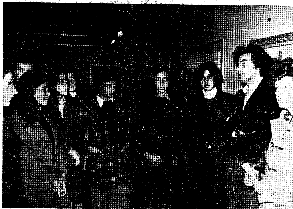
Las alumnas del Colegio Menor han efectuado una visita a la Exposición de Pintura del artista gerundense José Perpiñá Citoler, en la Sala de Exposiciones «Sant Jordi». Las jóvenes pertenecientes a 5.º y 6.º de bachiller, acompañadas por profesoras del Colegio, quedaron ampliamente informadas de las características de la obra de Perpiñá, ya que él personalmente tuvo la amabilidad de atenderlas durante su recorrido por la Exposición.