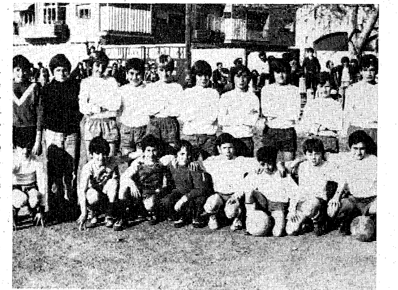
Uno de los conjuntos que compiten en tan interesante torneo, el C. F. Salt.