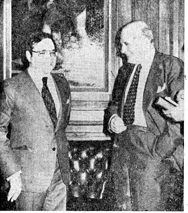
se entrevistó con el Presidente Tarradellas. A la entrada del Palau, los «mosos d'esquadra» que estaban de servicio le rindieron honores.