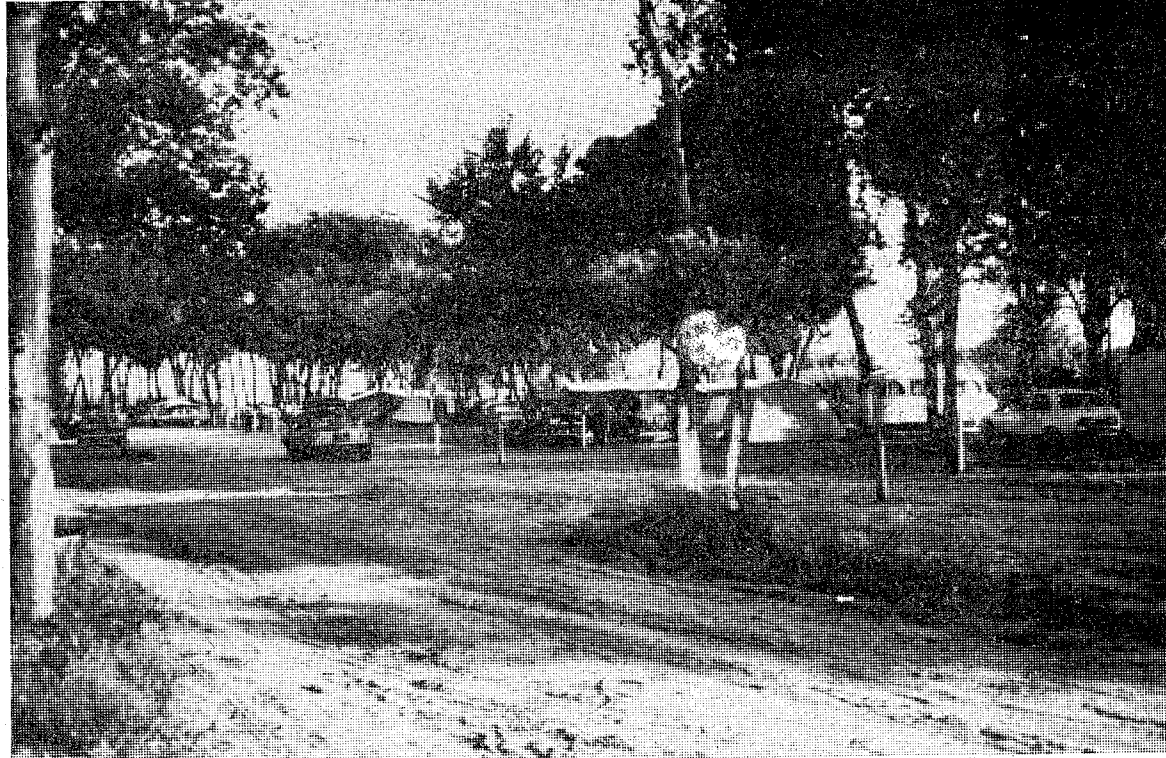
Uno de los muchos «campings» que están ubicados en la villa de Blanes.

No es de extrañar que insistamos una y otra vez en el tema del turismo, esa industria que en la balanza de pagos misma medida de progresión que el orden de aprovechamiento de oportunidades para hacer ascender los índices de ese servicio que se calcula, aproximadamente, en doscientos cincuenta mil hectáreas en el litoral y que sobrepasan