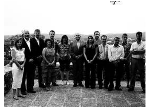
Els nous edils de l'Ajuntament de Llagostera.

El ple (al qual van assistir més de 60 persones, que van fer petita la sala), va transcórrer en un ambient de cordialitat entre les tres forces amb representació. Així, el portaveu de CiU, va dir: «Sarrià ha demanat un canvi, però això no treu que 24 anys de govern socialista no hagin sigut positius.» Roger Casero (PSC), va afirmar que el seu grup «accepta i respecta l'alternança», i que no