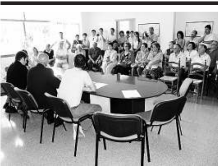
El ple d'ahir, amb les tres cadires del PSC buides.

En el discurs d'investidura, el nou alcalde va qualificar el pacte entre el PSC i AM de «natural», ja que «són les dues úniques formacions que han pujat en nombre de vots». Soms va explicar que els dos grups «han refós» sense gaires dificultats els seus respectius programes perquè «tenien molts punts en comú» i va afirmar que el nou govern treballarà «de manera clara, transparent i honrada».