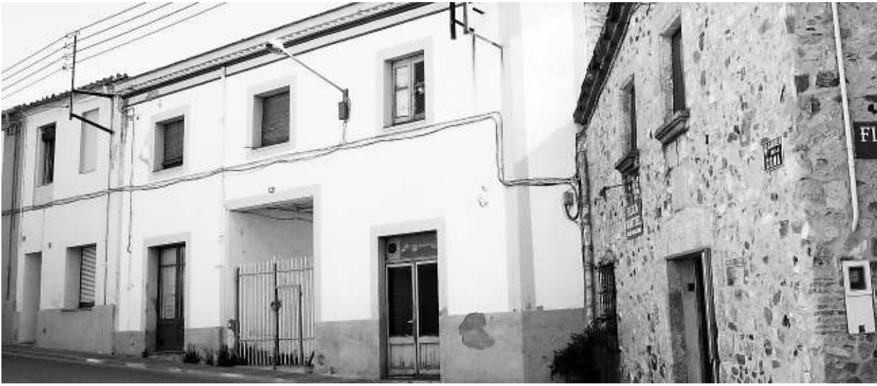
La casa objecte de la polèmica, al centre de la imatge.