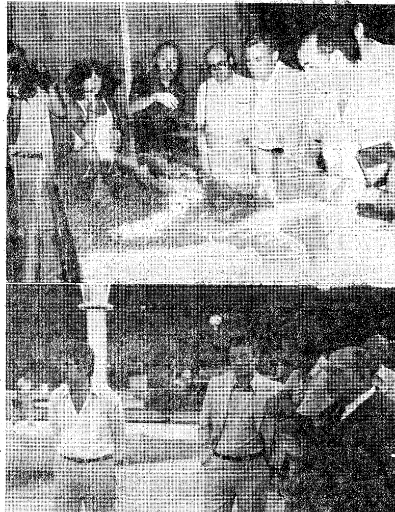
Representantes de los medios informativos y de los partidos políticos analizaron en profundidad la cuestión del puerto deportivo de Playa de Aro.

En primer lloc se realitzà un recorregut per la primera fase del citat port, en Punta Prima, on se situen i ocupen totalment 250 amarras, de les quals una cinquena part són de ús públic. Com se explicarà posteriorment, esta primera fase se té en règim de concessió estatal. El port (tècnicament es una base náutica) es totalment interior, únicament amb un espigó de salvaguarda del canal de accés. Utilitza el anticu cauce de la riera Ridaura, pues el actual discorre uns 400 metres més al Norte. Estos terrenos no tenian vegetación arbórea alguna. La segunda fase del puerto, que se realitza en terrenos en buena parte propiedad de la promotora, discurre paralela a la lfranza de playa, como se puede comprobar por parte de los asistentes, sobre los planos y maqueta presentada por los promotores. Precisamente antes de entrar en las oficinas de la promotora, una joven que afirmó ser representante del Partido Socialista en Playa de Aro, nos entregó unas hojas ciclostiladas, fechadas en Sant Feliu de Guixols, en las que se fija la postura del partido, según nos aclaró en criterio único para Playa de Aro y Sant Feliu sobre la citada obra. Suponemos que se aprovechó la cita de la promotora para la entrega de dicha hoja, que podía haber sido remitida, de forma habitual, a los respectivos medios informativos.