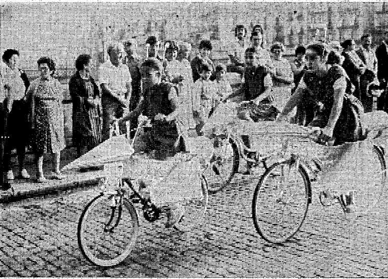
Colorido y fantasía..

Sin duda puede hablarse en un balance más que positivo, puesto que el objetivo perseguido por los organizadores del G. E. I E. G. hace cuatro años, después de revivir, tras un lapsus de tiempo, la tradicional «Festa del Pedal» es el de la participación. Como actividad popular y abierta a todos, conseguir esa numerosísima participación, que llenaron en una auténtica caravana de vehículos de dos ruedas, y a veces más, pues la originalidad, vista desde todos los ángulos y todos los prismas, no faltó por supuesto, el recorrido hasta Caldes de Malavella, supone con creces un éxito para quienes han colaborado y organizado la fiesta, un éxito que mantiene las ilusiones para la próxima edición, el año que viene.