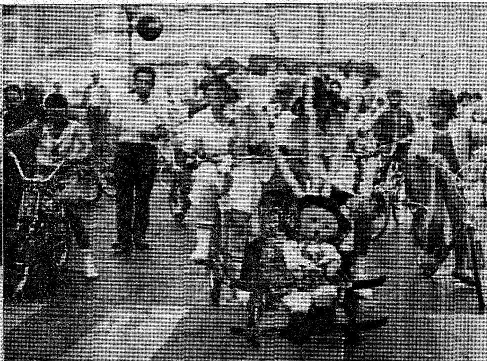
Muchos participantes en la «Festa del Pedal» prepararon con sumo cuidado sus monturas..

La «Festa del Pedal», repitió éxito en su vigésima edición a la que tomaron parte nada menos que 4.600 bicicletas en una multitudinaria y colorida participación en esta ocasión popular.