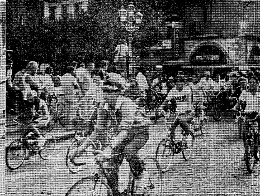
La salida en la Plaça del Vi y, después, la Rambla y el Pont de Pedra.