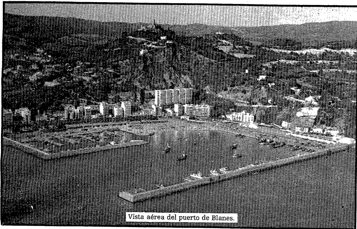
Vista aérea del puerto de Blanes.