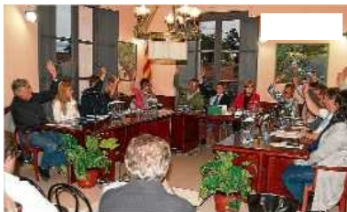
Una imatge del ple municipal de Caldes de Malavella el passat dilluns.

CALDES DE MALAVELLA | DAVID JIMÉNEZ El ple de Caldes de Malavella va aprovar dilluns l'adjudicació definitiva de la subhasta de la parcel·la del golf al PGA Golf de Caldes per 1.313.528 euros. La decisió es va prendre després que l'empresa 5.000 SL, guanyadora de la subhasta i que oferia 1.508.000 euros, 247.000 més del preu de sortida (1.261.000 euros) renunciés perquè no trobava finançament, de manera que calia adjudicar de nou la venda a la segona empresa que va participar en la subhasta.