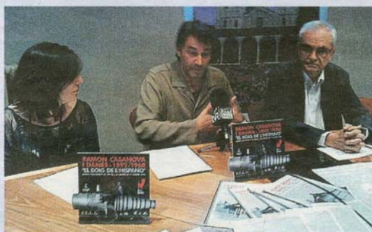
Aquesta setmana es va fer la valoració d'aquesta mostra