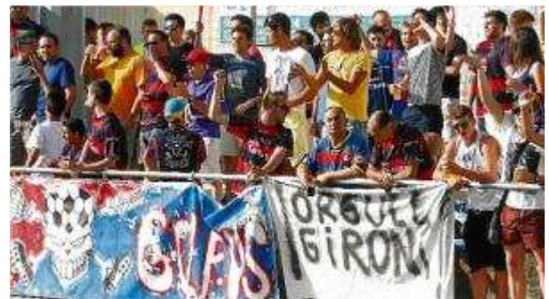
L'orgull gironí, més present que mai a Llagostera aniol rescl

ROBERT GÜELL | LLAGOSTERA Feia goig. El Municipal de Llagostera va presentar ahir una gran imatge. La millor de la temporada. Moltes persones van viure el partit dempeus i no hi havia ni un sol seient lliure a les graderies (supletòries o no). La parròquia tarragonina va fer-se notar i escoltar (no tant, però, com la del Racing de Santander). Lògicament, a part de tarragonins, el municipal de Llagostera també es va omplir de gironins que senten passió pel futbol i que no es van voler perdre el que acabaria sent una jornada històrica. Hi havia molts aficionats d'arreu de la demarcació gironina que van deixar constància que l'orgull gironí existeix.