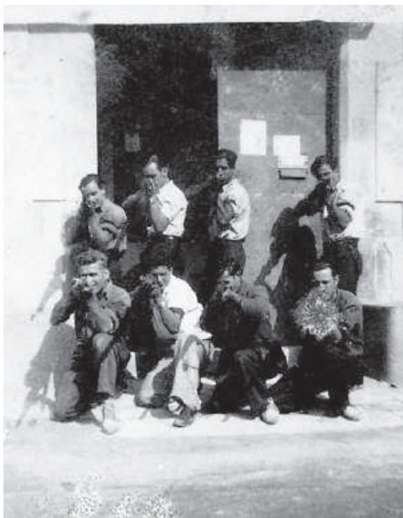
El comitè a la porta de l'Ajuntament de Caldes, el juliol del 1936.