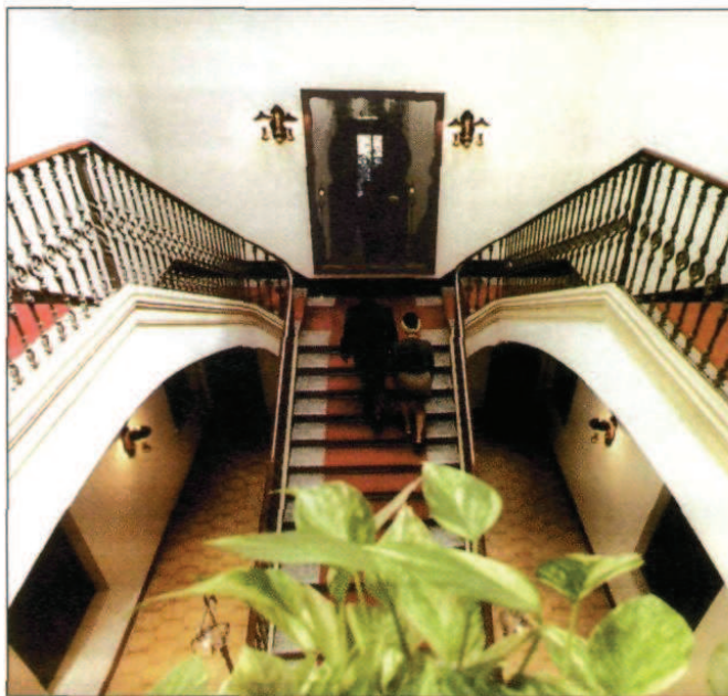
Al Vichy Catalán s'hi respira la tènue intemporalitat dels establiments termals.

El Gran Balneari Vichy Catalán de 1994 no té res a veure amb l'atrotinat establiment de l'anterior paràgraf. Conservant la pràctica totalitat de les dependències i serveis que li varen donar fama des del primer dia (immens i curadíssim parc al voltant de l'edifici, capella pròpia per a l'atenció espiritual del clients, zona d'hidroteràpia sotmesa a un estricte control mèdic, grans salons per