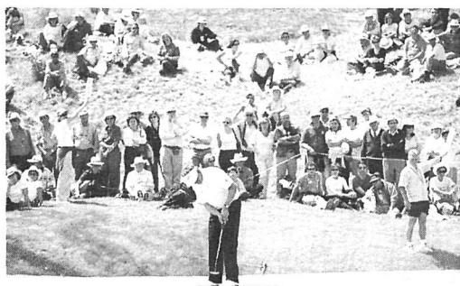
■ EL CAMP DE GOLF DE CALDES ES CONSO-LIDA. El camp de la PGA de Caldes de Malavella va acollir amb èxit l'Open Peugeot i es va consolidar dins l'elit dels camps de golf europeus. El torneig va reunir alguns dels millors jugadors del món, com ara Olazabal, Montgomerie i Sergio Garcia.