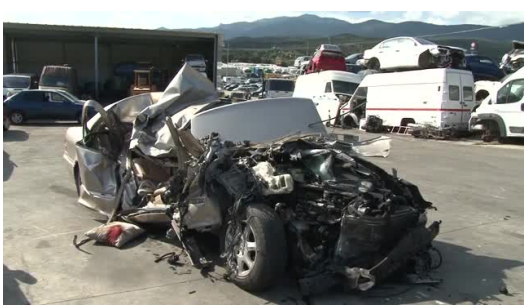
Mor una dona en un turisme en xocar contra un camió a l'AP-7, a la Jonquera

El conductor del cotxe ha resultat ferit de gravetat