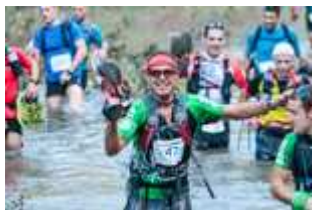
Trepitja Garrotxa-Oix 2014: riu Llierca