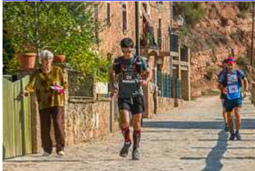
Vallès Drac Race Trail-Terrassa 2014