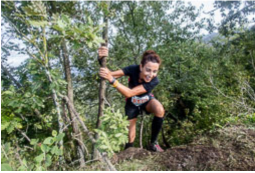
Trail del Bisaura 20 km Sant Quirze de Besora-2014