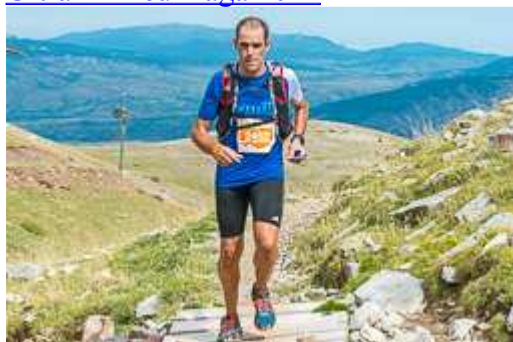
Marató Pirineu Bagà-Bellver 2014