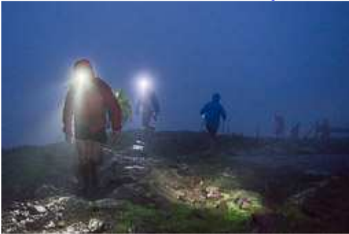
5 Cims-Montseny 2014