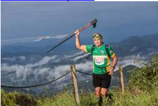
Trail del Bisaura 44 km Sant Quirze de Besora-2014