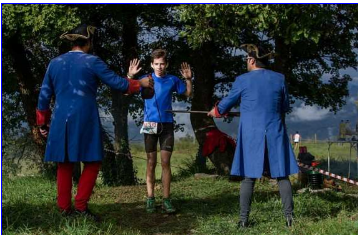
Els Miquelets també han estat presents al Trail del Bisaura.

Classificacions Trail del Bisaura-44 km 2014 (pdf)