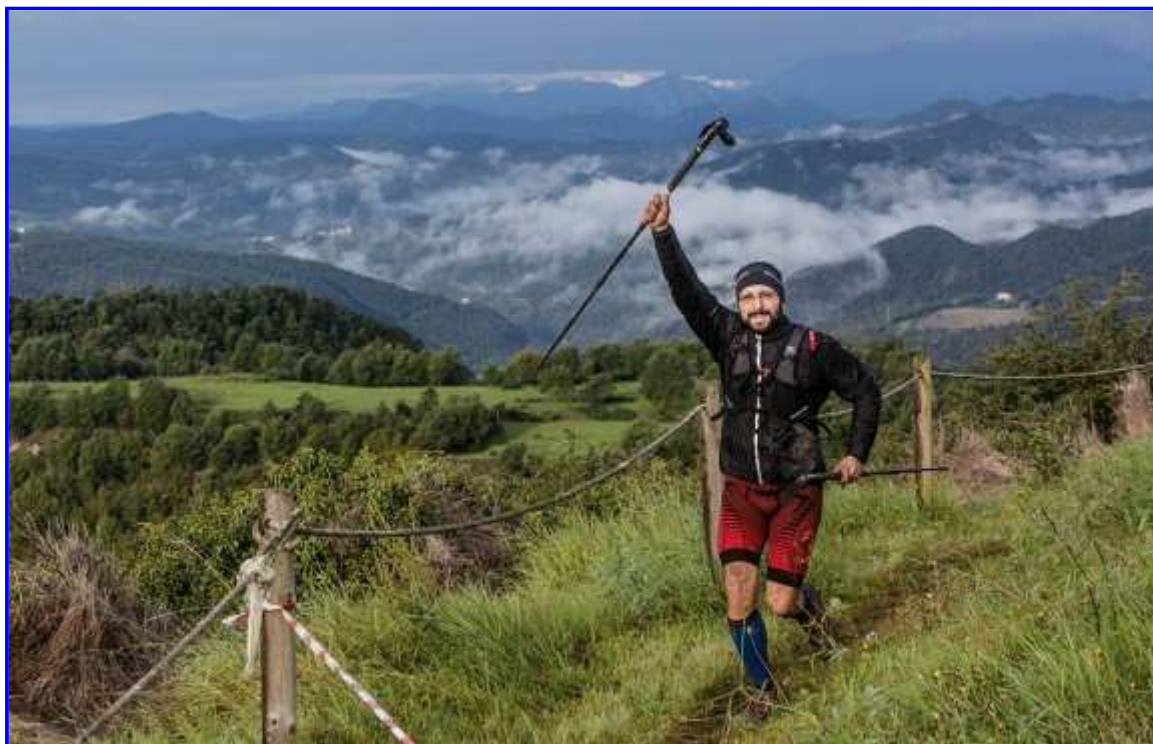
Un dels participants a la Trail del Bisaura arribant al Castell de Besora.

Fotos del Trail del Bisaura-20 km 2014