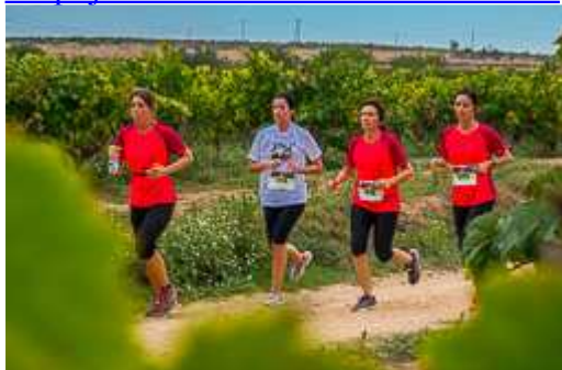
Trail Senders del Penedès-Les Cabanyes 2014