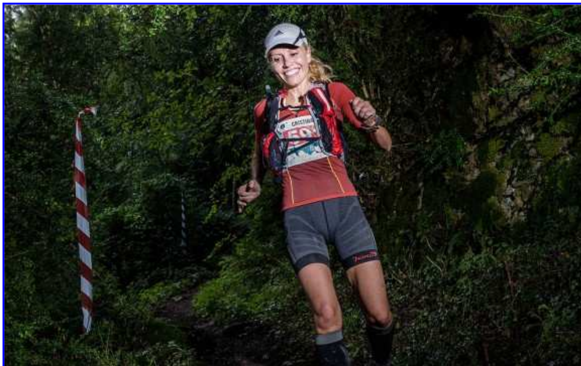
Una de les participants a la cursa de 20Km baixant del Castell de Besora. Foto: Adrià Costa

Fotos del Trail del Bisaura 2013 (Josep Maria Montaner)