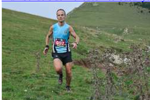
Taga 2040 Evo-Sant Joan de les Abadesses 2014