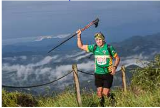
Trail del Bisaura 44 km Sant Quirze de Besora-2014