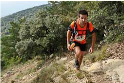
Trepitja Garrotxa-Oix 2014: Mare de Déu del Mont