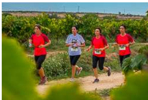
Trail Senders del Penedès-Les Cabanyes 2014