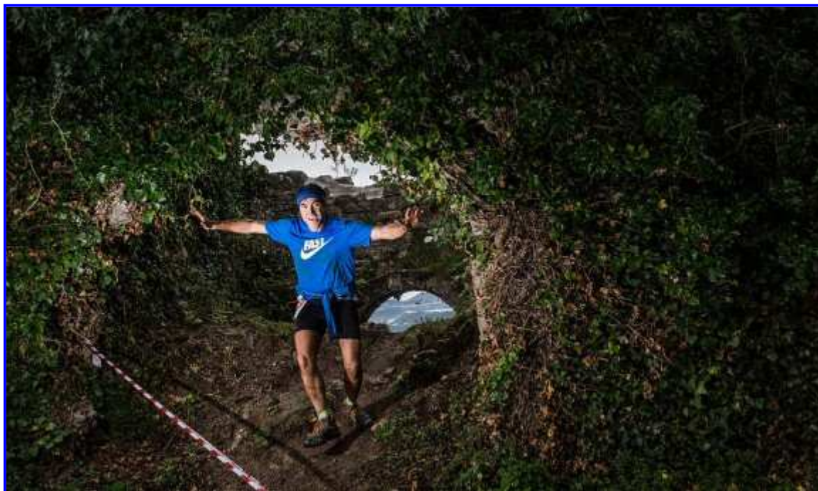
Un dels corredors del Trail del Bisaura, al castell de Besora.

Un dels punts singulars del Trail del Bisaura era la presència d'"animadors" especials. En destacaven els Miquelets que una vegada arribaven els corredors al castell de Besora els encanonaven amistosament.