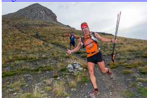
Ultra Pirineu-Bagà 2014