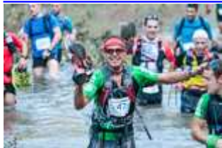
Trepitja Garrotxa-Oix 2014: riu Llierca