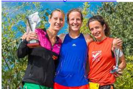
Cursa al Castell de Sant Miquel de Girona 2014 Vegeu més galeries