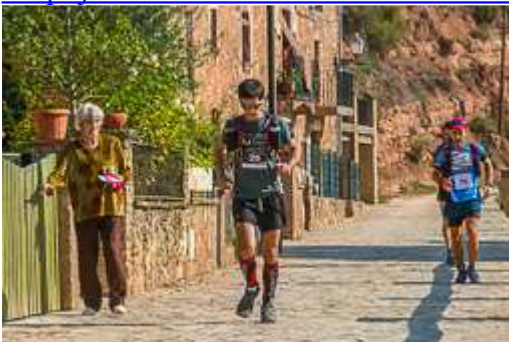
Vallès Drac Race Trail-Terrassa 2014