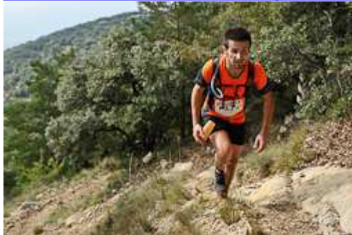
Trepitja Garrotxa-Oix 2014: Mare de Déu del Mont