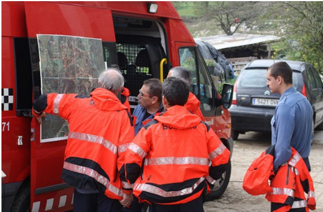
Operatiu de recerca per trobar l'avi desaparegut.