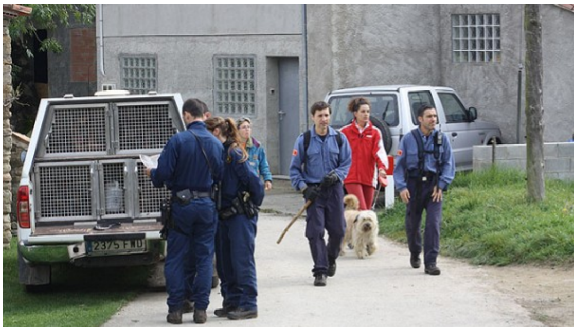
Operatiu de recerca per trobar l'avi desaparegut

Les tasques per trobar-los es reiniciaran aquest dijous al matí | Se l'ha continuat buscant intensament, aquesta tarda també amb helicòpter, a la zona del Remei i el Catllar de Ripoll