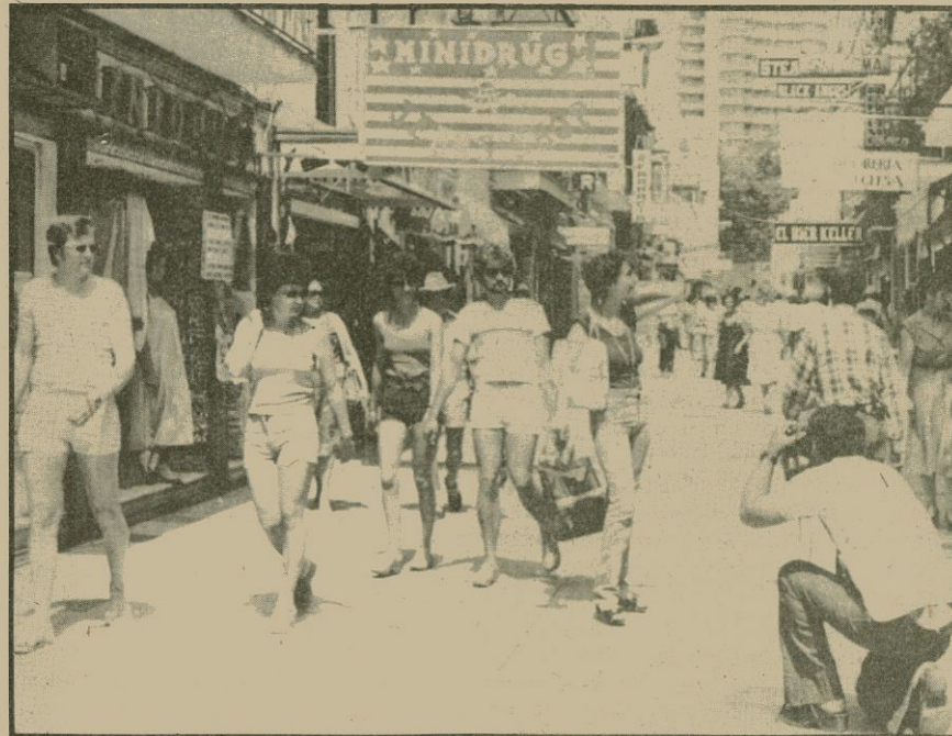
Turisme: el sol és el mateix, però els preus pugen

«Cal arribar a una reconversió de l'oferta turística, si no volem que en cinc anys Espanya deixi de ser una potència turística», va declarar ahir a Europa Press Jordi Petit Fontserè, director general de Turisme de la Generalitat, en relació amb la temporada que ara es clou.