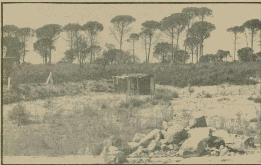
«L'edifici» que s'hi ha bastit no justifica la tallada de pins

Prop d'un centenar de catalans residents a Buenos Aires vindran a començament del pròxim mes d'octubre a Barcelona en una visita organitzada pel Casal de Catalunya de la capital argentina. Els «catalans d'Amèrica», com ells mateixos s'anomenen, volen obsequiar la nostra ciutat amb una escultura en bronze, original de Wifred Viladrich, que representa l'amalgama d'aquests catalans amb l'amor pel país i el poble que els donà acolliment.