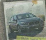
BMW Serie 2 Active Tourer