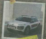
Citroën C4 Picasso

Coches seleccionados como candidatas de la Votación Final