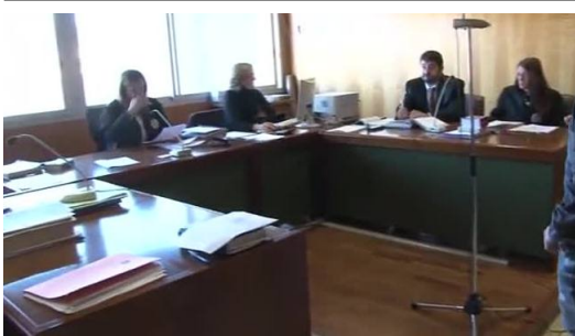
2,5 anys per matar un noi en un accident

Conduïa begut, sense carnet i es va estampar contra un fanal en fer una virolla amb el fre de mà