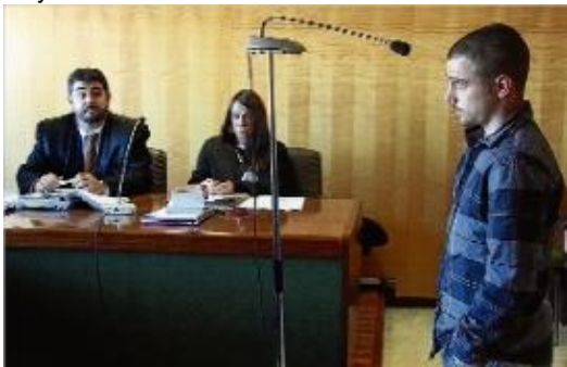
L'acusat que conduïa sense carnet i que portava la víctima de copilot.