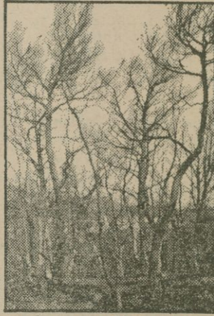
Encara no s'han pogut calcular les hectàrees cremades

A Sant Llorenç, on hi ha bon nombre de casetes d'estiujants, foren enxarpades diverses persones mentre es dedicaven a robar les cases abandonades a causa del perill del foc. En un primer moment i donat que molta de la gent que es trobava a casa seva al voltant de les dues de la tarda, hora en què començà el foc, estava sola esperant els qui havien anat a la