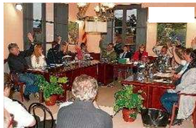
Moment del ple de Caldes de Malavel·la on es va aprovar el pressupost.

Els republicans van mantenir que Caldes té pel 2015 "el pressupost més important dels darrers anys gràcies a les propostes d'ERC" perquè "s'ha incrementat un 150% el pressupost de Benestar" i "s'han acordat partides relacionades amb habitatge social, servei d'atenció domiciliària o l'augment del SIAD". Per la regidora d'ERC,