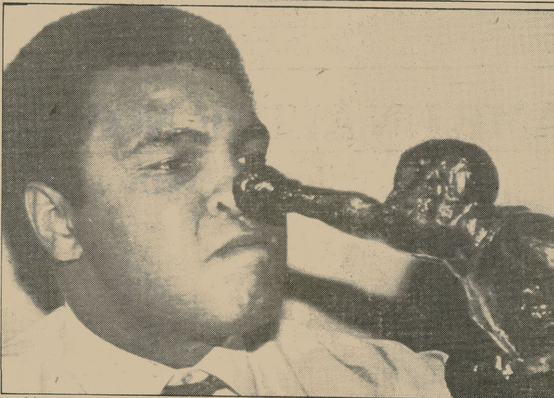
Muhammad Ali, fent broma amb el premi Rocky Marciano que li van lliurar ahir a Nova York