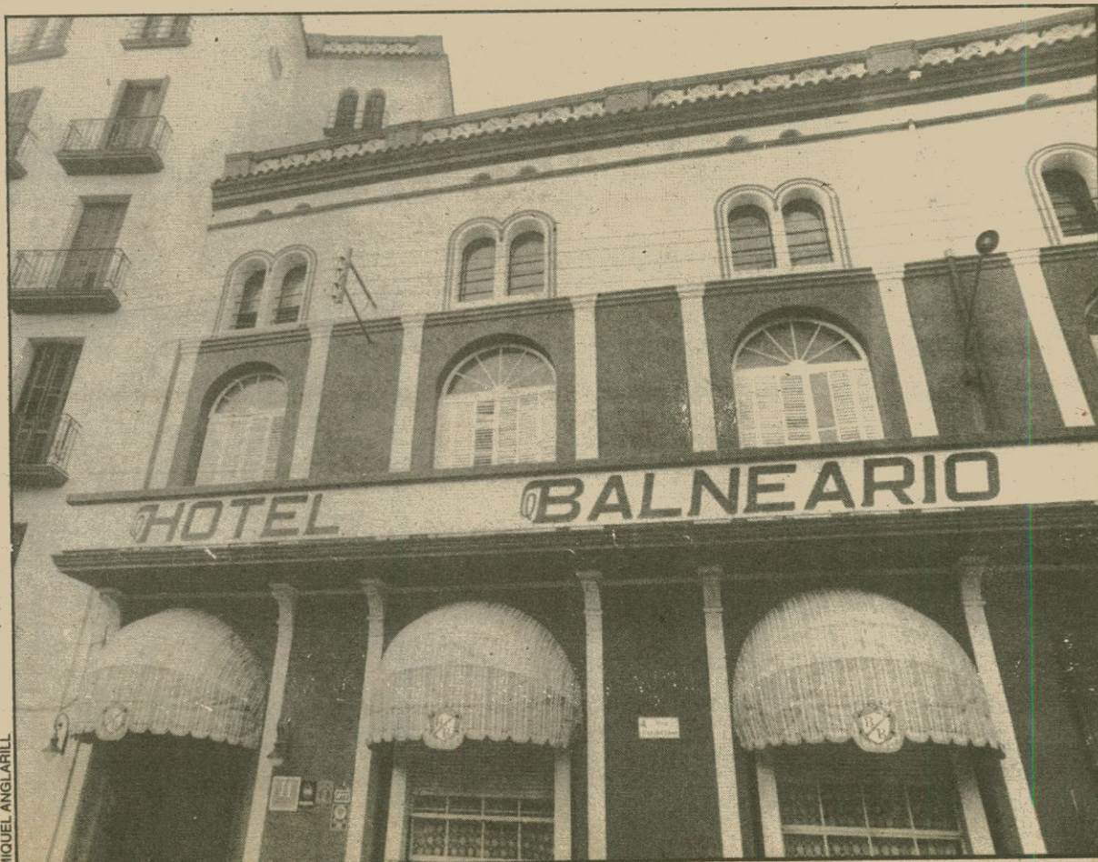
Els balnearis han netejat las façanes i comencen a ser moda altre cop

Com havia succeït a principi de segle, s'observa ara a Catalunya una presència d'intel·lectuals i artistes en balnearis per a aprofitar les seves condicions de llocs tranquils i agradables que s'afegeixen a les qualitats termals de les seves aigües.