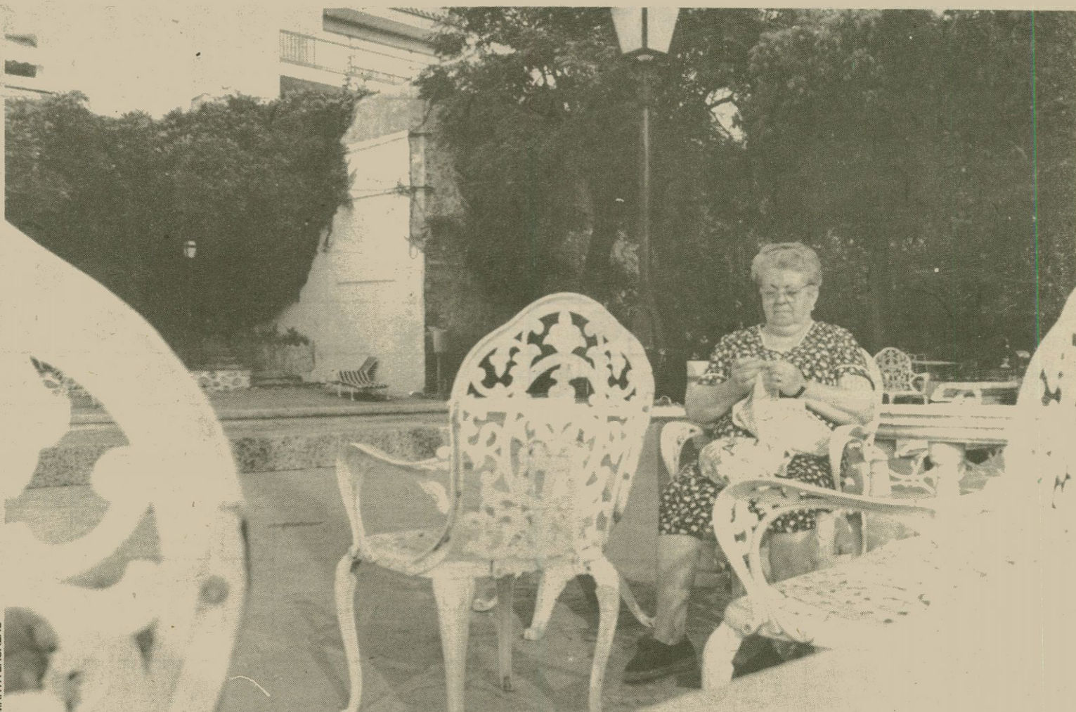
Principalment, però no exclusivament, els clients dels balnearis són la gent gran

Després d'un període de llarga crisi, torna la moda de les aigües termals