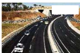
L'Estat afirma que al gener reprendrà el desdoblament entre Medinyà i Orriols

SILS | PILI TURON inauguració del desdoblament entre Sils i Caldes. La ministra Ana Pastor, amb Llanos de Luna al seu darrere, destapant la placa inaugural. A la dreta, Santi Vila aplaudeix. Els alcaldes de Maça-net, Caldes i Sils (d'esquerra a dreta). Diversos vehicles circulant pel nou tram de l'A-2.