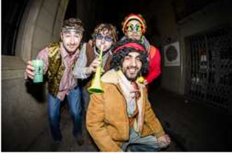
Ruta Hippie del Carnestoltes de Ripoll