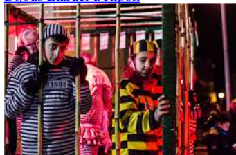
Rua de Carnestoltes de Campdevàno