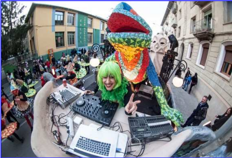
Rua de Carnestoltes de Ripoll.

Tretze carrosses i comparses , amb un total de 450 persones, participaran dissabte a la rua de Carnestoltes de Ripoll. Una celebració que estarà molt pendent de la meteorologia però que es vol celebrar de “totes a totes”, segons han explicat a aquest mitjà fonts de la Comi de Ripoll. La Ruta Hippie del Romànic, que se celebra aquest divendres a la nit, obrirà el foc aplegant més de 600 persones.