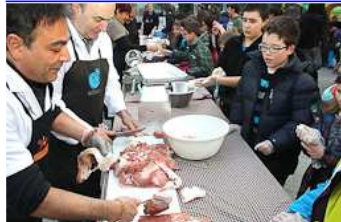
Dijous Llarder a Ripoll