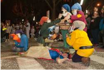
Rua de Carnestoltes de Sant Joan de les Abadesses