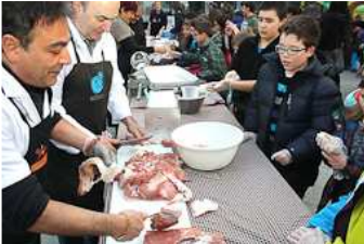
Dijous Llarder a Ripoll