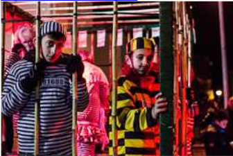
Rua de Carnestoltes de Campdevàno