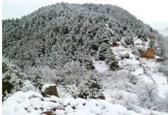
Nevada del 19-20 de gener al Ripollès