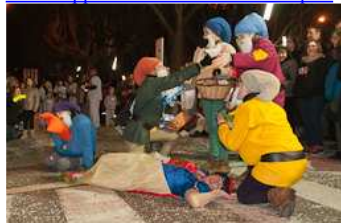
Rua de Carnestoltes de Sant Joan de les Abadesses