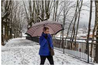
Nevada del 19 de gener al Ripollès Vegeu més galeries