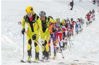
Crononúria-Memorial Ramon Casadevall