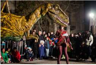
Rua de Carnestoltes de Ripoll