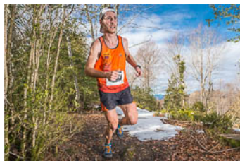
Corriols de Foc de Vallfogona