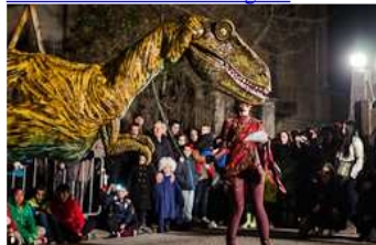
Rua de Carnestoltes de Ripoll