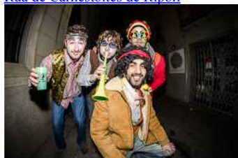
Ruta Hippie del Carnestoltes de Ripoll