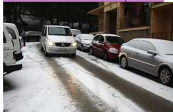
Nevada del 4 de febrer a Ripoll