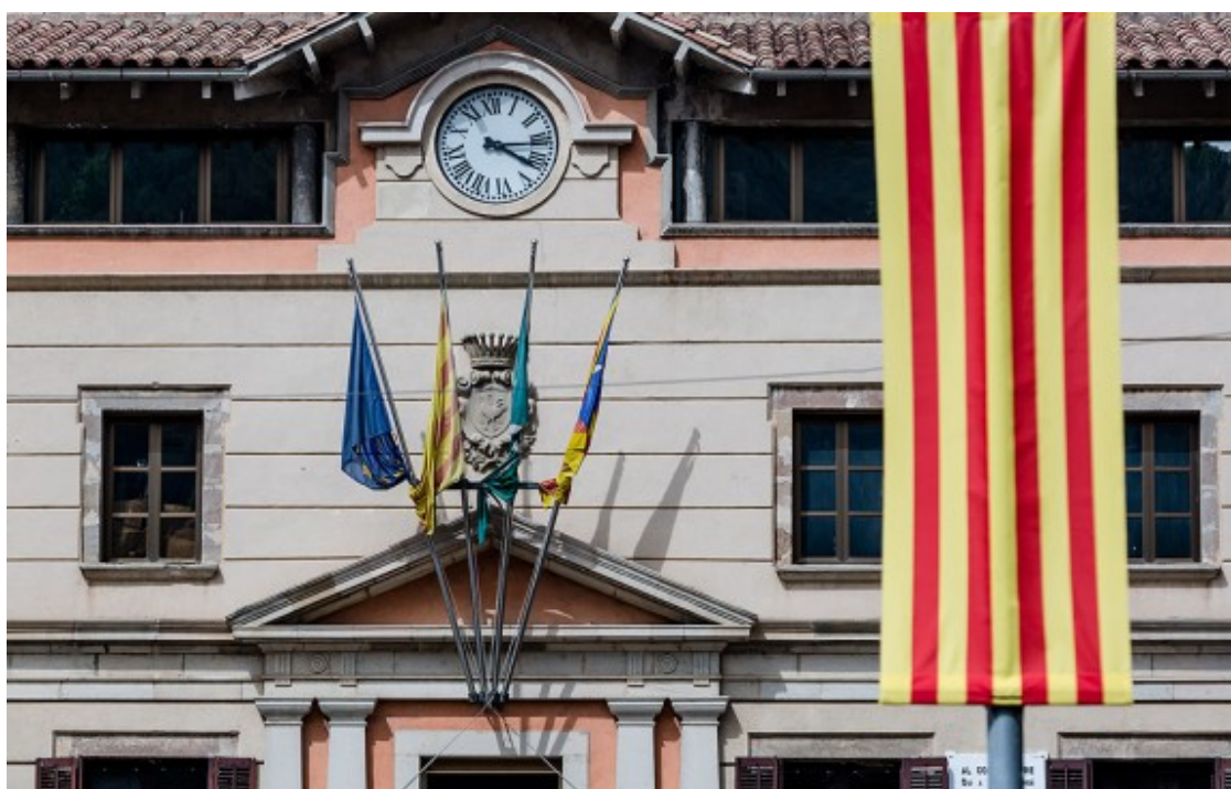
Façana de l'Ajuntament de Ripoll.

Al Ripollès estan decidits 18 dels 19 alcaldes i només queda la incògnita de Camprodon