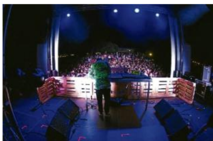
L'escenari del Festival l'Era en plena sessió de Gold Panda, dissabte a la matinada. diari de girona

La masia de Can Gascons, enmig dels boscos de Llagostera, va acollir dissabte la tercera edició del Festival l'Era que va atreure les 1.500 persones que permet el seu aforament. DJ Capo, Lili's House, Wesphere, Tversky, El último vecino, The New Raemon, Jupiter Lion, Sau Poler i Djonhston van completar un cartell de més de dotze hores de música que es mou entre les aigües de l'indie-rock i l'electrònica. Més electrònica com més avança la nit.