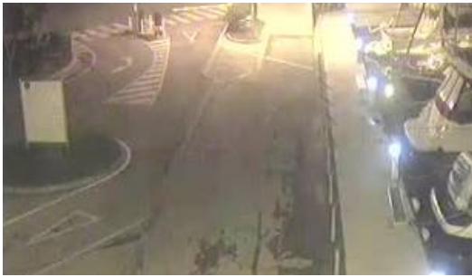
Terratrèmol a la Costa Brava

L'epicentre es va ubicar a la zona del golf de Roses, va provocar l'alarma entre els veïns i els cossos d'emergències durant la matinada, però no va ocasionar danys ni ferits