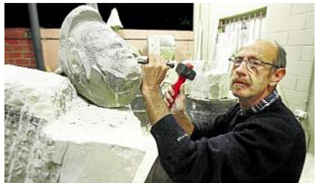
L'aprenent aprèn del mestre i el mestre també aprèn de l'aprenent' aniel resclos:

Quin és el millor lloc per a una escultura?