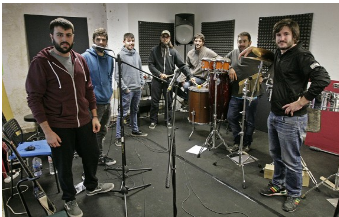
Els components de Txarango al local d'assaig que tenen a Gurb.

- Sí, és cert. Hem tingut la sort que cada vegada que hem hagut de prémer el gas, el cotxe ha tirat tan ràpid com esperàvem. Sempre hem tingut la sensació de posar una excusa perquè passés una cosa... i que acabés passant. Som uns afortunats.