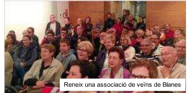
Reneix una associació de veïns de Blanes