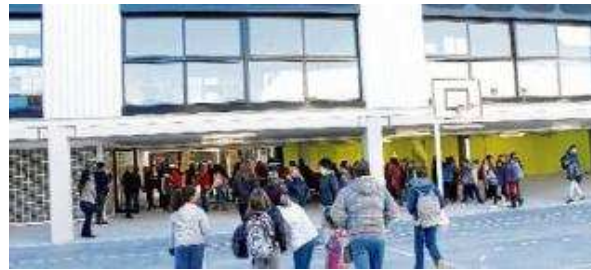
L'escola La Benaula estrena el nou edifici després de 10 anys en barracons a Caldes

CALDES DE MALAVELLA | D. JIMÉNEZ Els alumnes, pares, mares i l'equip docent de l'escola La Benaula de Caldes de Malavella tenien ahir un motiu especial per llevar-se i anar a classe. Finalment, aquest dilluns han pogut estrenar el nou i esperat edifici de La Benaula després de 10 anys en barracons.