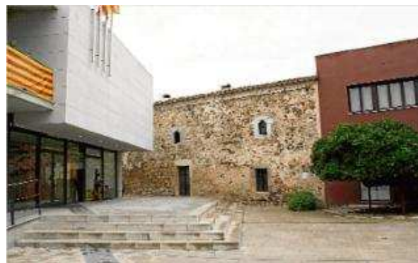
Imatge actual de l'edifici de l'Ajuntament al costat de l'antiga masia de Cal Ferrer, que quedaran connectats. carles colomer

A banda, els materials que s'utilitzaran per a la rehabilitació seran "nobles, naturals i eficients per a l'ús", tenint en compte que es tracta d'un edifici històric.