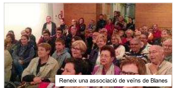
Reneix una associació de veïns de Blanes