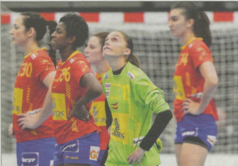
Las jugadoras de la selección española se lamentan tras perder contra Francia.