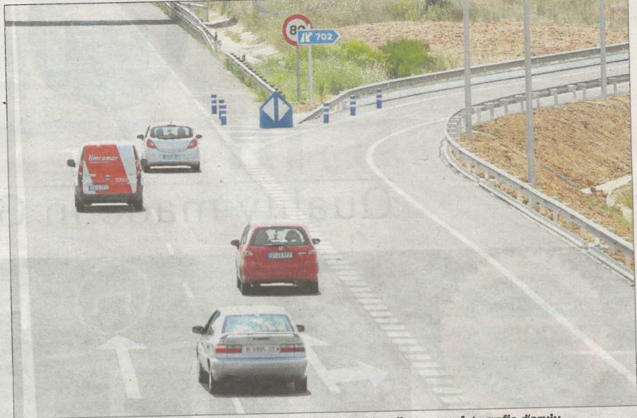
Enllaç entre l'Eix Transversal desdoblament i la N-II a Caldes de Malavella, en una fotografia d'arxiu.