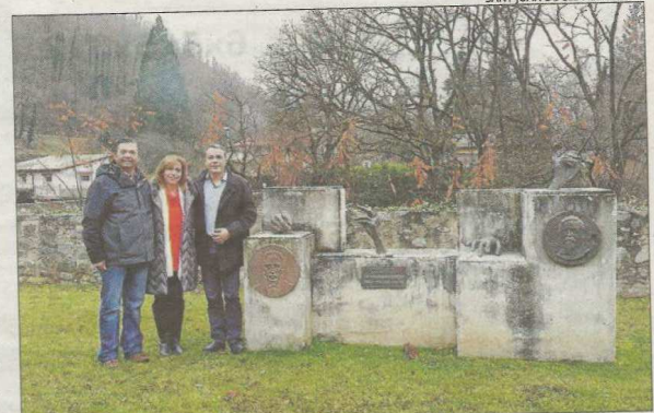
A l'esquerra, el senador mexicà de visita a St. Joan de les Abadesses.