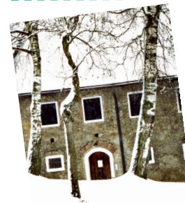
Casa de Bernhard