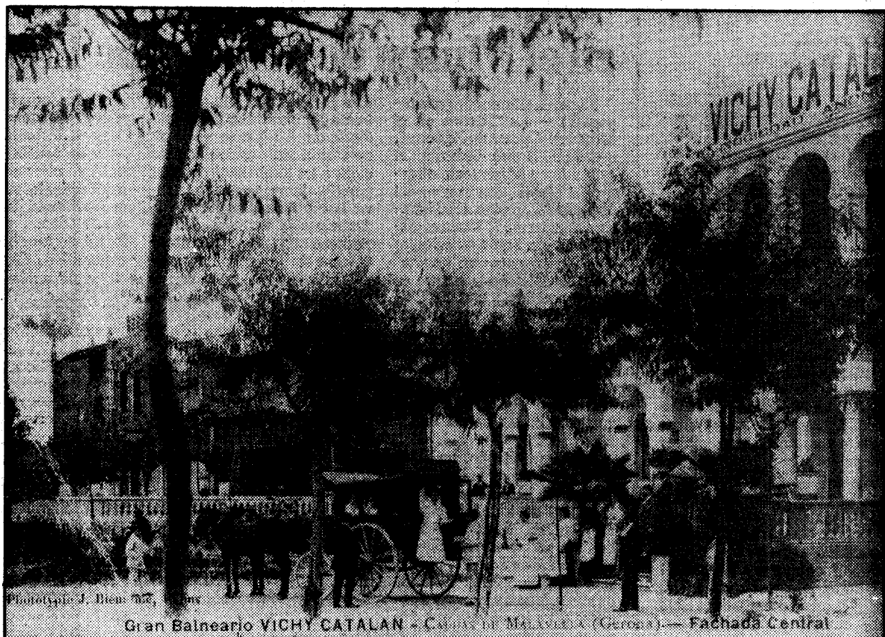
Gran Balneario VICHY CATALAN - Caldes de Malavella (Girona) - Fachada Central

Observó que el ganado y los cerdos acudían a la mina a abrevarse