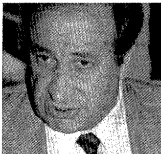
JESÚS GIL Y GIL