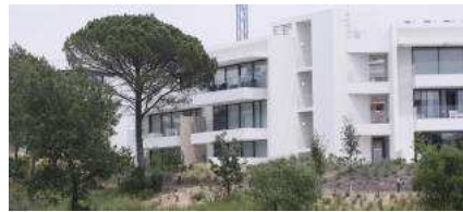
Una de les luxoses edificacions del PGA Catalunya Resort. marc martí

CALDES DE MALAVELLA | PEP T. En l'argot dels amants del golf, el nou projecte que ha dissenyat el grup PGA Catalunya Resort es troba al tee , al punt de sortida. La companyia afronta un «forat» llarg, dels que requereixen diversos «cops» abans no s'aconsegueix ficar la piloteta blanca a dins. L'objectiu, segons avançava ahir el diari Expansión , posar en marxa d'aquí a tres anys unes vinyes, uns cellers, un estany amb «club nàutic» i una platja artificial, una hípica i nous habitatges de luxe. Amb el nou projecte, valorat en uns 20 milions d'euros, el propietari de PGA Catalunya Resort, Denis O'Brien -el tercer home més ric d'Irlanda segons la revista Forbes, amb una fortuna de 6 bilions de dòlars- , busca que el complex de Caldes de Malavella guanyi un « Gran Slam » (el màxim èxit que pot assolir un golfista professional) molt particular: que es confirmi com el millor camp d'Europa , amb la mirada posada en la possible designació de Caldes com a seu de la Ryder Cup 2022, la competició més emblemàtica del circuit golfístic internacional.