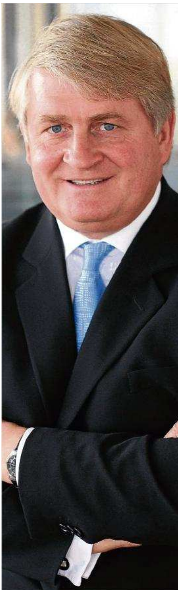
Denis O'Brien posseeix una fortuna bilionària, segons la revista "Forbes" diari de girona

Des de principis d'any -així ho recullen les edicions de The Irish Times (9/1/2016) i del britànic The Guardian (11/1/2016)-, el bilionari del golf és investigat pel Criminal Assets Bureau (Oficina d'Actius Criminals, CAB), institució irlandesa que identifica i investiga els propietaris de béns o serveis sospitosos d'estar relacionats amb activitats criminals. El CAB s'ha fixat ara en O'Brien després que The Tribunal Inquiry d'Irlanda (més conegut com el Moriarty Tribunal, creat ad hoc l'any 1997 per fiscalitzar casos de corrupció que esquitxen a polítics), reportés, l'any 2011, que el tycoon del golf de Caldes, tal com recollia Raidió Teilifís Éireann (RTÉ, la televisió pública irlandesa), que l'exministre de Comunicacions, Michael Lowry, va "ajudar-lo" a obtenir un llicència de telefonia mòbil a mitjans dels anys 90 per al consorci Esat Digifone. Les amistats perilloses de Lowry, que actualment és Teachta Dála (diputat del Dáil Éireann, la Cambra Baixa del Oireachtas, el Parlament irlandès, per la circumscripció de North Tipperary, i que fins l'any 2002 va