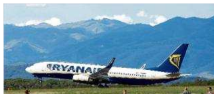
El benefici de Ryanair, a velocitat de creuer: 1.242 milions, un