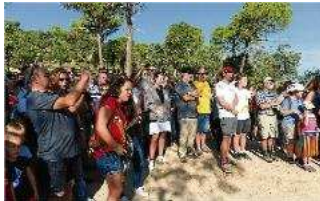
Caldes de Malavella Unes 350 persones, a Terra Negra diari de girona

Unes 350 persones es van aplegar a Terra Negra, on limiten els termes de Llagostera, Tossa de Mar, Caldes de Malavella i Vidreres i on, des de fa catorze anys, donen el tret de sortida a la Diada. Enguany, l'organització l'ha fet Caldes. Es van cantar Els Segadors i es va fer un esmorzar popular. caldeS | marc sureda