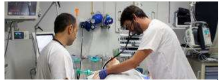
Imatge de l'atenció d'un box d'urgències de l'Hospital Trueta de